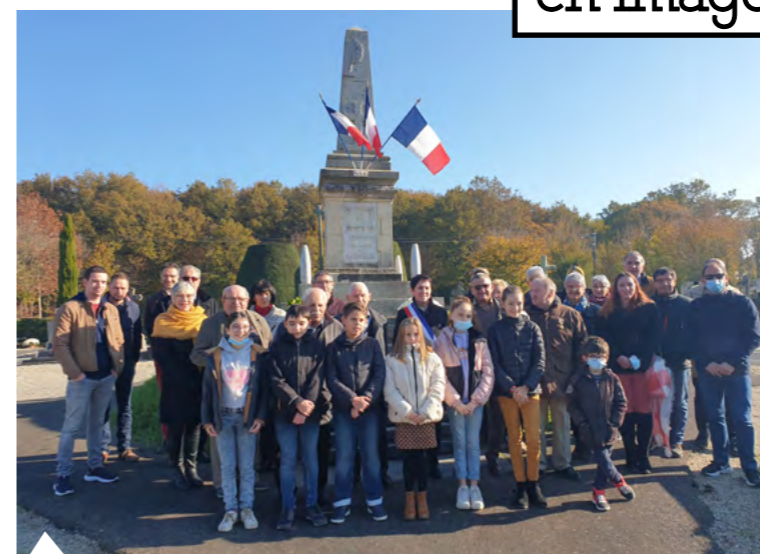
11 novembre : Participation du Conseil Municipal des Jeunes à la cérémonie de commémoration.