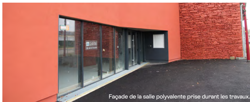
Façade de la salle polyvalente prise durant les travaux.

16 rue de la Mairie - 44390 PUCEUL 02 40 51 35 54 - mairie@puceul.fr