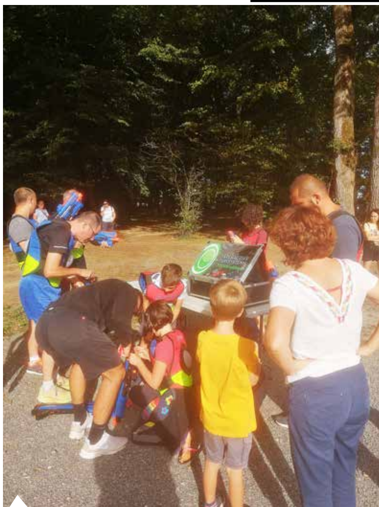
19 août : « Action, réaction », animation Loisirs à l'Air Libre de la CCN.