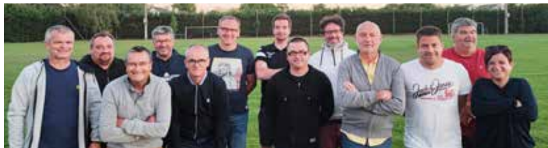
Le nouveau Conseil d'administration du GJFPB

Label foot jeune et Label foot féminin récompense l'investissement et la qualité du travail effectué par l'ensemble des éducateurs, dirigeants et bénévoles du groupement. C'est aussi un encouragement pour continuer à faire évoluer le GJFPB.