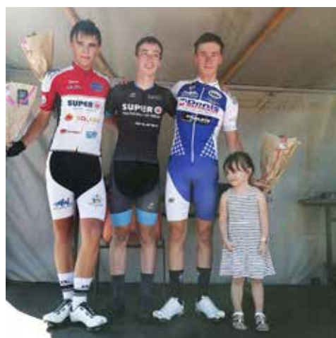
30 et 31 juillet : Reprise des courses de la Pédale puceuloise après 2 années d'arrêt avec 350 participants sur 2 jours. Ici, le podium « Cadets ».