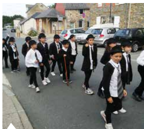
3 juillet : La kermesse de l'école s'est déroulée avec notamment pour thème « Charlie Chaplin ».