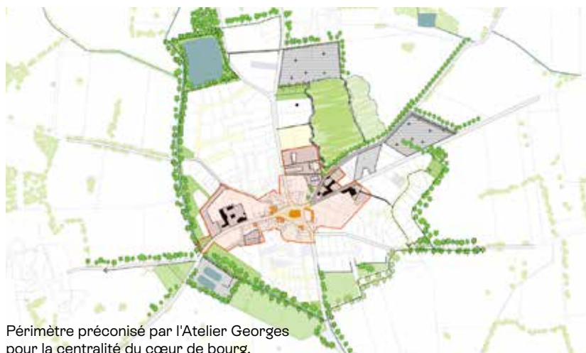
Périmètre préconisé par l'Atelier Georges pour la centralité du cœur de bourg.

"Demain à Puceul" permettra de répondre rapidement aux différentes sollicitations lancées par le gouvernement, et notamment l'Appel à Manifestation d'Intérêt (AMI) cœur de bourg qui vise à accompagner les projets de requalification urbaine dans le domaine de l'habitat, de la transition écologique, des mobilités, des services et commerces de proximité.