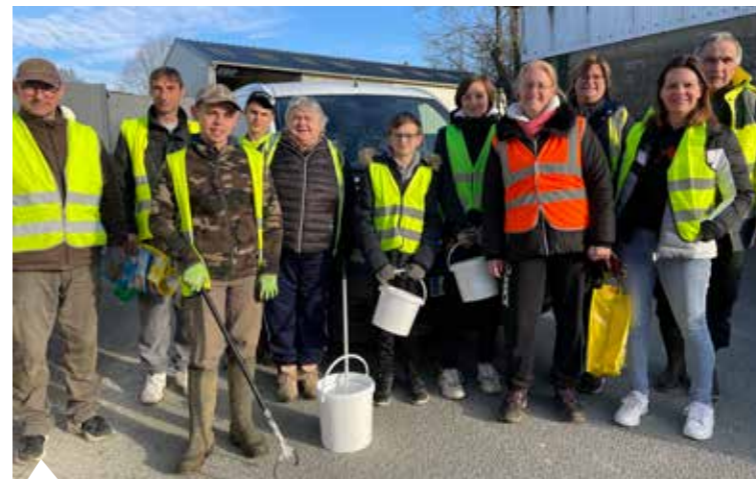
11 février : 1 ère édition de l'opération "Puceul propre", à l'initiative du Conseil Municipal des Jeunes : 250 kg de déchets ont été ramassés.