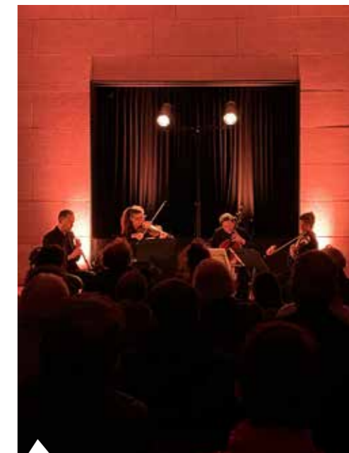
17 janvier : "Un hautbois chez les cordes", concert classique et audacieux par l'ensemble Stradivaria, a été présenté en salle Prosper Saffré devant quelques 70 personnes.