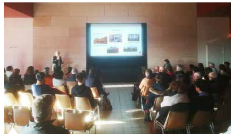
21 janvier : Vœux de la municipalité avec la présentation du bilan de l'année 2022 et des projets des adjoints au Maire et de leurs commissions..